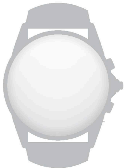
Orologio con cassa rotonda