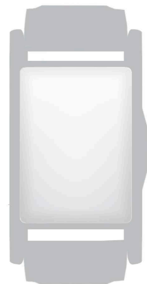
Orologio con cassa rettangolare